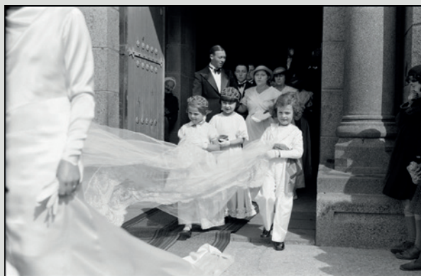
Raphaël Binet, Port-Briant mariage , 1935

Les photographies de Raphaël Binet, que vous retrouverez tout au long de l'exposition, présentent des similarités avec celles de Guy Le Querrec dans la volonté de capturer l'instant et dans le travail de composition, ici le hors-champ.