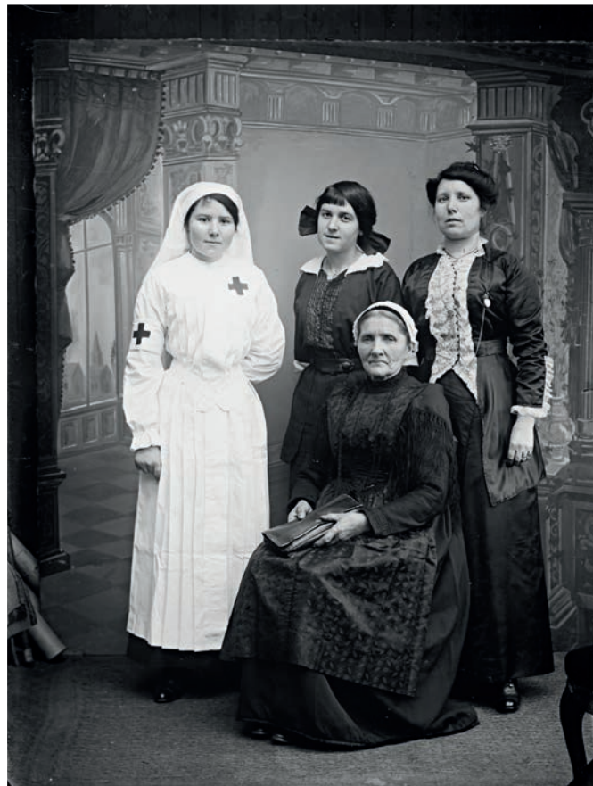
Anne Catherine, Portrait de femmes , négatif sur verre, verre (noir et blanc), première moitié du 20e siècle, licence CC-BY-NC-ND, collection muséale, Musée de Bretagne et Écomusée de la Bintinais.

Le master MAGEMI a pu s'appuyer sur les nombreuses photographies issues des collections du Musée de Bretagne, qui sont pour la majorité identifiées sous la licence CC-BY-NC-ND (2563) et CC-BY-SA (2227).