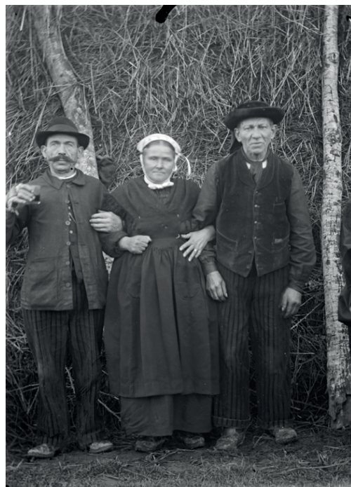
Anne Catherine, Portrait de groupe , négatif sur verre, verre (noir et blanc, gélatino-bromure d'argent), 1ère moitié du 20e siècle, licence CC-BY-NC-ND, collection muséale, Musée de Bretagne et Écomusée de la Bentinais.