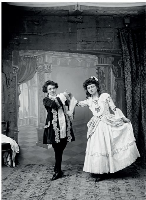
Anne Catherine, Portrait de femmes , négatif sur verre, verre (noir et blanc, gélatino-bromure d'argent), avril 1913 - mai 1913, licence CC-BY-NC-ND, collection muséale, Musée de Bretagne et Écomusée de la Bentinais.