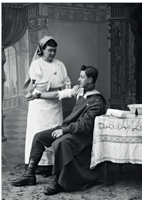
Anne Catherine, Portrait de soldat , négatif sur verre, verre (noir et blanc, gélatino-bromure d'argent), 1915, licence CC-BY-NC-ND, collection muséale, Musée de Bretagne et Écomusée de la Bentinais.