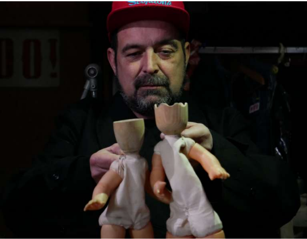
Scopitone & Cie, Kamikaze? , 2005