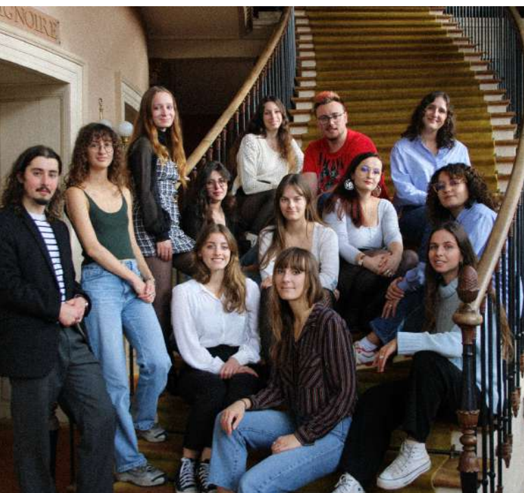
Photographie officielle de la promotion MAGEMI 15.